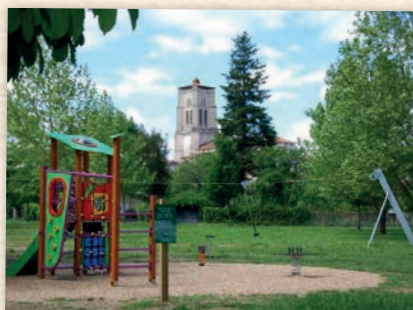
Installation d'une Aire de jeux Voie Verte Saint-Astier