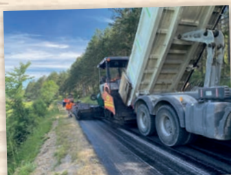
Réfection voirie Saint-Astier Route des vertes collines