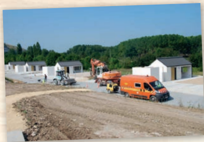
Construction Aire d'accueil des gens du voyage