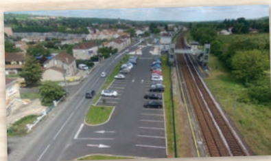
Aménagement des parkings des gares de Neuvic, Saint-Astier et Saint-Léon-sur-l'Isle