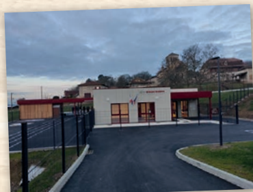
Construction Groupe Scolaire de Douzillac