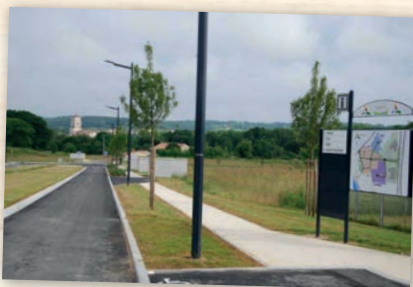
Aménagement du parc Astier Val'