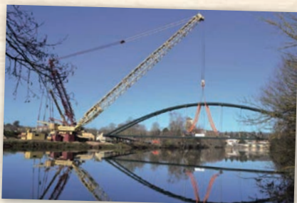
Création Véloroute Voie Verte