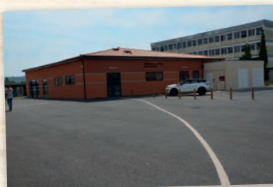
Construction Restaurant Scolaire Saint-Astier