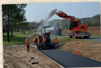
Création d'une voie douce à Neuvic-sur-l'Isle