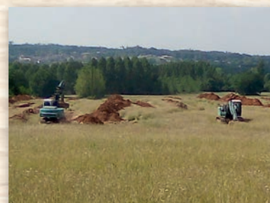
Aménagement zone Ganfard de Sourzac (fouilles archéologiques)