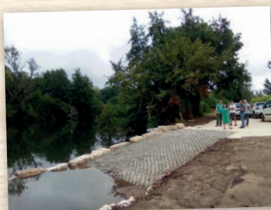
Cales à bateaux à Douzillac et St-Léon et un ponton à Neuvic