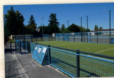
Construction terrains multi-sports à Neuvic-sur-l'Isle et St-Léon-sur-l'Isle