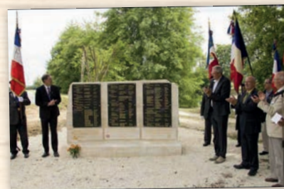
Mémorial St-Léon Voie Verte