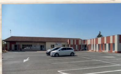
Restructuration pôle administratif de la CCIVS