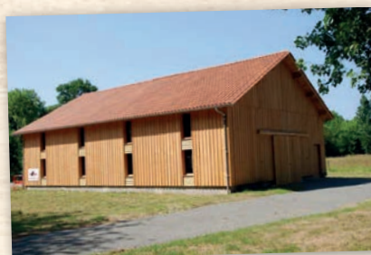
Réhabilitation d'un hangar Voie Verte Neuvic