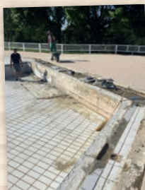
Travaux piscine de Neuvic