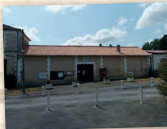
Changement toitures écoles de Saint-Germain et Montrem