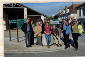
Mise en place d'une signalisation économique et touristique